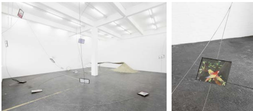
Several birds fly away when they understand it , 2012 Eisen, Erde, Zeichnungen (1996-1998), Dimensionen variabel