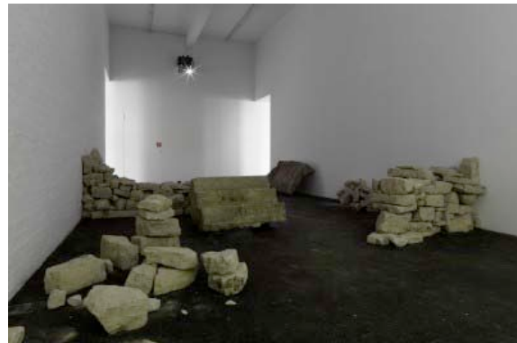
Who does the earth belong to while painting the wind?! , 2012 Video 13', Steine, Dimensionen variabel