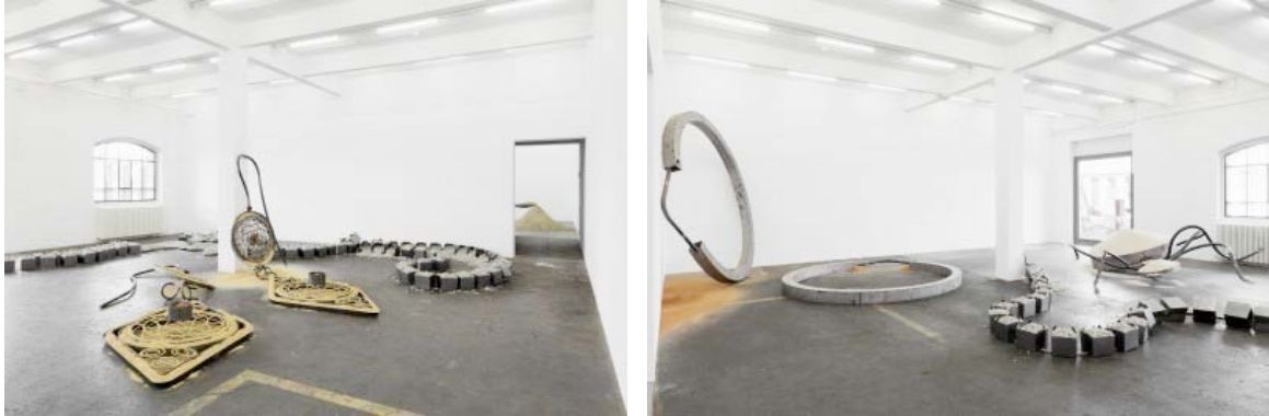
It is the first time dear, that you have a human shape, 2012

Eisen, verschiedene verarbeitete Steine der Ruine aus dem Kosovo, Dimensionen variabel